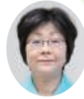
きぼうの杜ひのき