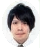
川崎医科大学附属病院

今期より、岡山玉野支部の役員をさせて頂く事に成りました。総会・支部長会議に出席させて頂き、団結力と力強いパワーを感じると共に、支部長としての責任の重大さを痛感しています。看護の現場を良くする為、看護の力を強化できるように、微力ながら皆様の協力を得ながら役割を果たして行きたいと思ひます。宜しくお願い致します。